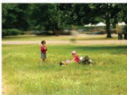
සාමාන්‍ය දෘෂ්ටි පරාසය