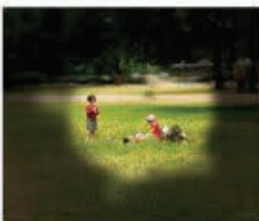
මධ්‍යස්ථ ග්ලූකෝමා තත්ත්වයේදී දෘෂ්ටි පරාසය