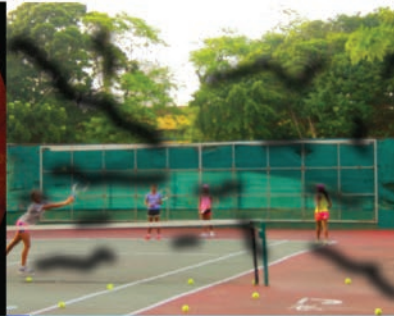
බයබෙට්ස් රෙටිනොපති තත්ත්වය නිසා පෙනෙන පරාසය හානිවී ඇති ආකාරය